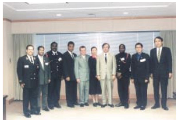
細野光弘消防庁次長と消防行政管理者研修員（9月18日）